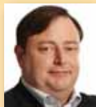
Bart De Wever (Berchem)