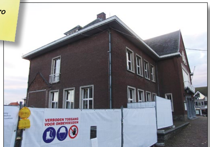
Nieuw gemeentehuis kost handenvol geld

Kostprijs: 1\,500\,000 + 350\,000 = 1\,850\,000 euro