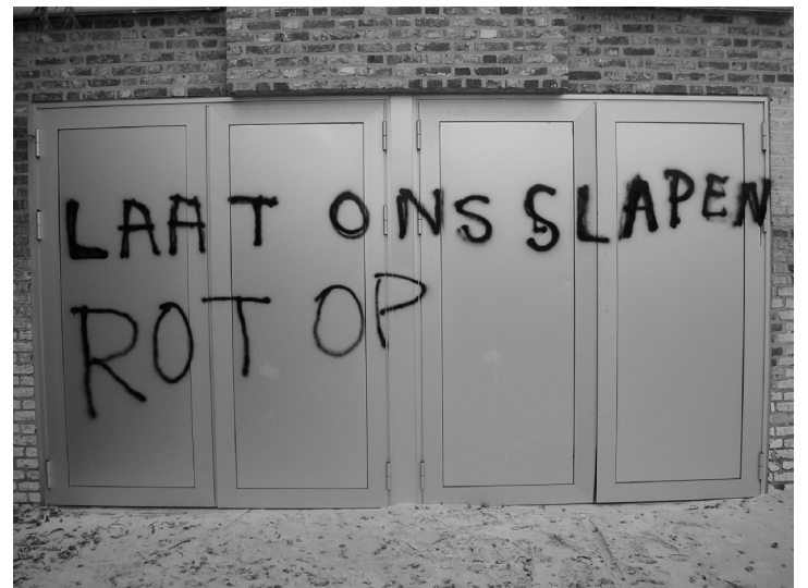
Deze noodkreet "siert" de niet-akoestische buitendeuren

Ik heb alvast voorgesteld om het laden en lossen via de deuren achteraan te verbieden tussen 22u 's avonds en 10u 's morgens. Het schepencollege ging mijn suggestie meenemen. Hopelijk doen ze er ook wat mee.