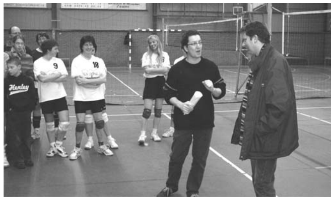
De overhandiging van de petitie "Sportvloer NU!". Toen lukte het niet, nu komt de nieuwe vloer er gelukkig wél.

Uiteindelijk liet ook de meerderheid zich overtuigen, en werd het voorstel van N-VA/PLE en Groen! goedgekeurd. Een werkgroep moet er nu voor zorgen dat er zo snel mogelijk een vloer ligt. Vandekeybus : "Dat zal wellicht niet meer lukken tegen het nieuwe sportseizoen, jammer genoeg. Maar 1 januari 2008 zou toch haalbaar moeten zijn. Zodat we eindelijk terug veilig en verantwoord kunnen lopen en springen in de Heuvelhal."